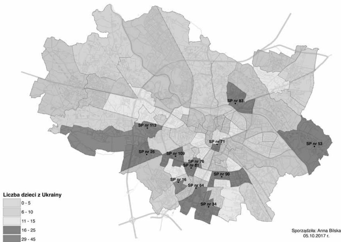
Mapa 1. Liczba dzieci z Ukrainy we wrocławskich szkołach podstawowych w roku szkolnym 2017/2018 – rozłożenie według placówek