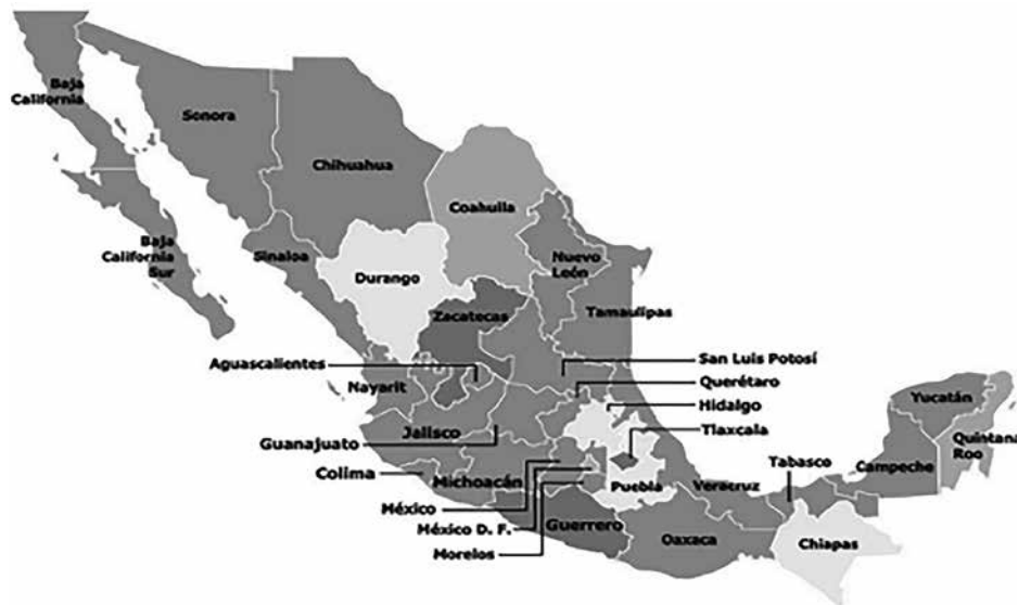
Mapa 1 – mapa stanów w Meksyku