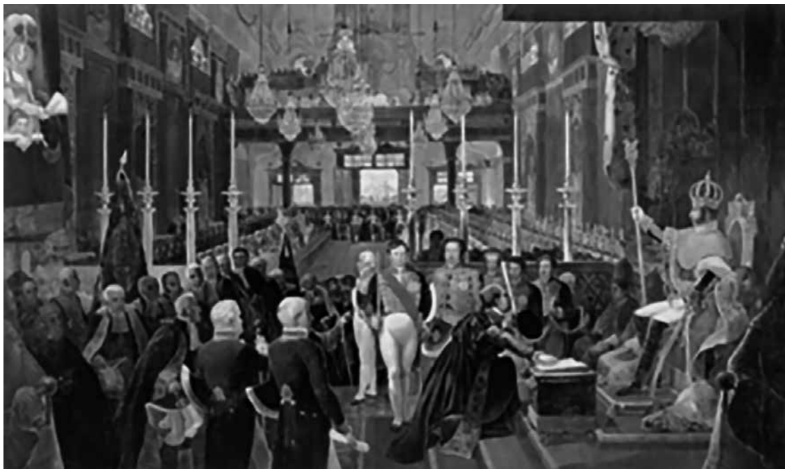
Rys. 1 Koronacja Pedro I na Cesarza Brazylii