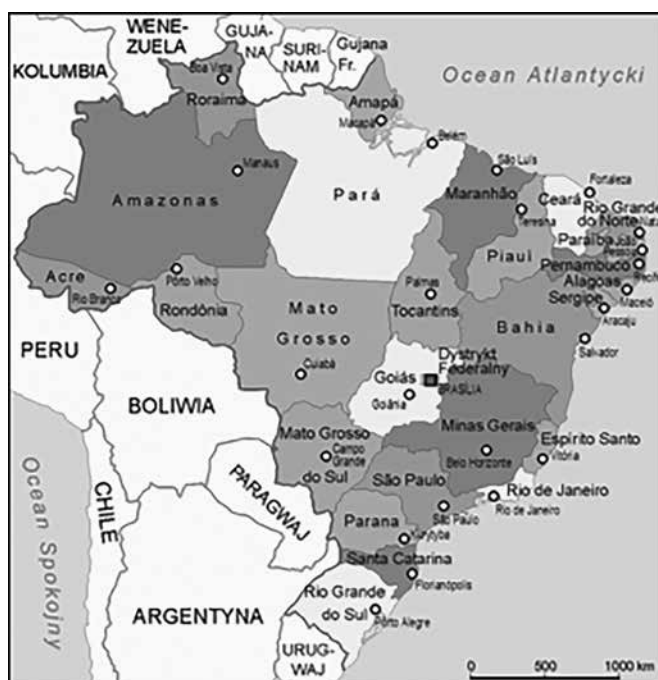
Mapa 1. Podział terytorialny Brazylii.